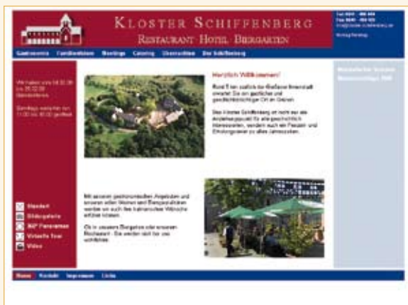
Restaurant Kloster Schiffenberg Gießen www.kloster-schiffenberg.de