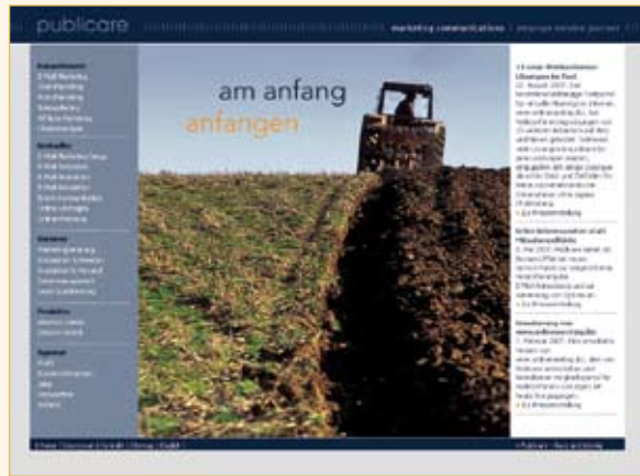
Publicare Marketing Communications GmbH Frankfurt am Main www.publicare.de