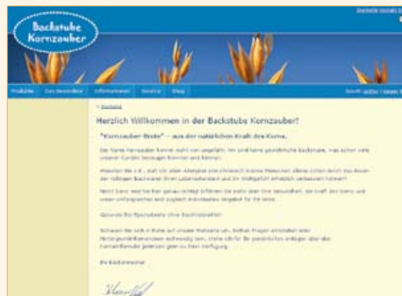
Backstube Kornzauber Poppenhausen www.kornzauber.de