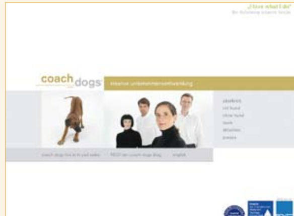
coach dogs Kreative Unternehmensentwicklung, Lich www.coach-dogs.de