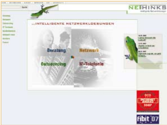
Nethinks GmbH Fulda www.nethinks.de