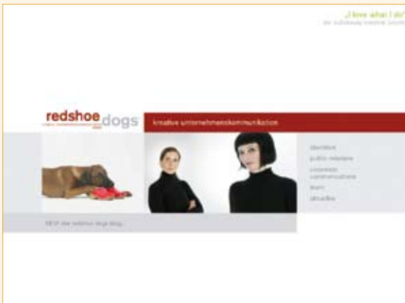
redshoe dogs Kreative Unternehmenskommunikation, Laubach www.redshoe-dogs.de