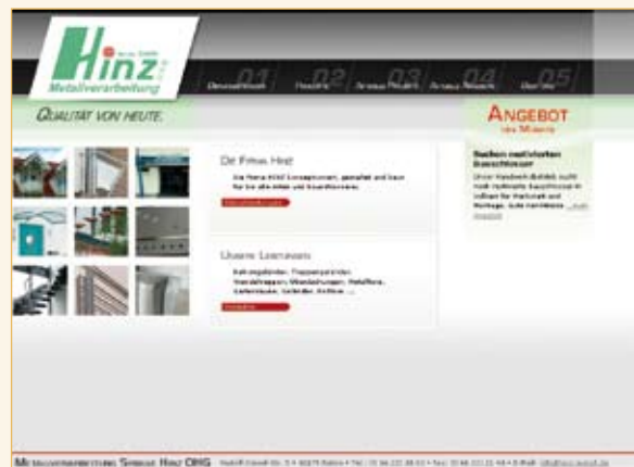
Metallverarbeitung Sybille Hinz OHG Bebra www.hinz-metall.de