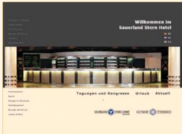
Sauerland Stern Hotel Willingen www.sauerland-stern-hotel.de