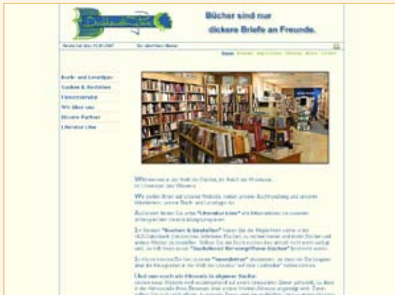
Buchhandlung am Park Bad Nauheim www.buchhandlungampark.de