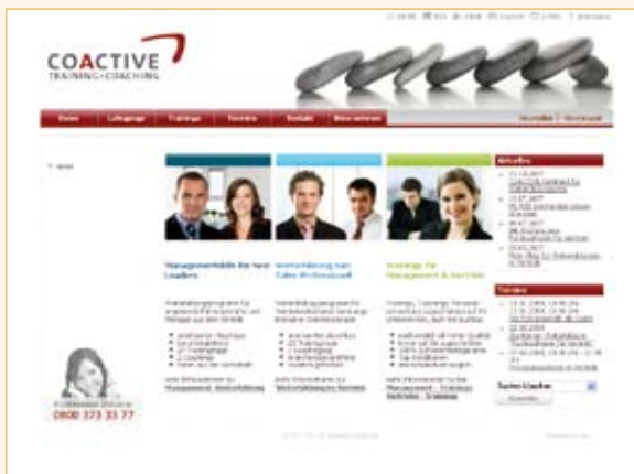
Coactive GmbH Kassel www.coactive.de